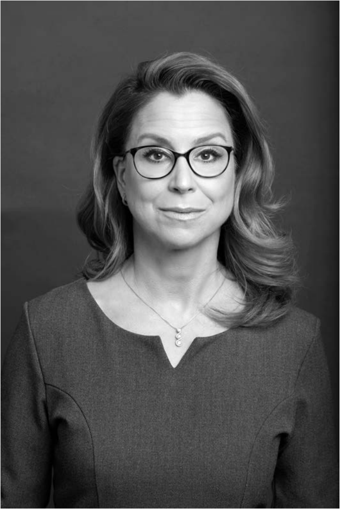
Carola Veit Präsidentin der Hamburgischen Bürgerschaft