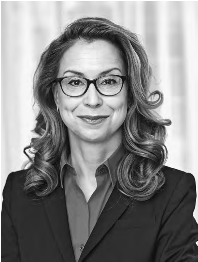
Carola Veit Präsidentin der Hamburgischen Bürgerschaft